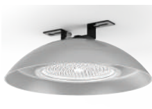
2 Bracket para techo