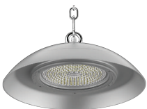
1 Gancho y cadena